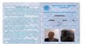
Figura de qualificação civil: é a página que possui as informações pessoais

>> Carteira de Trabalho: A Carteira de Trabalho é obrigatória em todas as situações para comprovação de trabalho. Anexar a carteira de trabalho de todos os integrantes do grupo familiar, maiores de 14 anos, que a possuírem. Anexar as seguintes páginas: primeira página, onde constam o número do registro e a foto; o verso da página, onde está descrita a qualificação civil; a página com informações sobre o último contrato de trabalho e a próxima página em branco. No caso de Carteira de Trabalho Digital: anexar página com os dados pessoais e os contratos de trabalho com os dados da empresa e os valores recebidos. Caso não possua Carteira de Trabalho: anexar uma declaração que não possui ou usar o formulário de informações excedentes conforme modelo disponível no Portal ND, para fazer a declaração que deve ser assinada conforme documento em anexo.